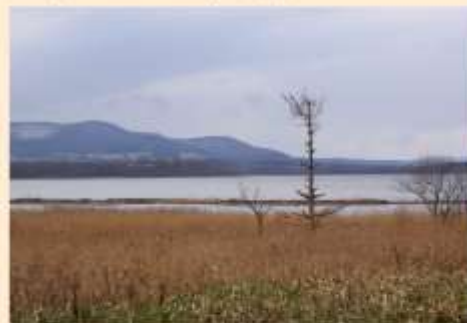
トレーラーハウスからの風景