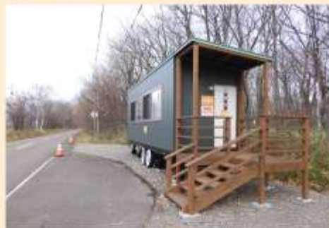
2台目のトレーラーハウス

また、3月末までにもう1台設置予定となっています。場所は番屋がある湖口付近で、外海を観察できるとのことです。海が荒れた日は普段は沖に居る珍しい種が見えることがあります。トレーラーハウスの中では風雨を避けて観察することができるでしょう。もし冬も開放されるなら流水を屋内からゆっくり眺める贅沢な時間にも使えそうです。どちらも双眼鏡、フィールドスコープは設置や貸出はありませんので、各自でお持ちになりお楽しみください。(桑原)