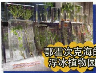
鄂霍次克海的 浮冰植物园