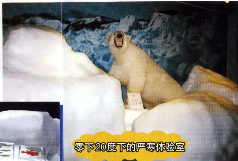
零下20度下的严寒体验室

能够亲身体验严寒的房间。犹如严冬下的纹路市，温度一直保持在零下 20 度，即使在酷热的夏日也可以触摸到真正的浮冰