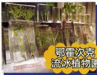
鄂霍次克 流冰植物園