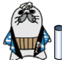
ゴマフアザラシ (紋別出身)