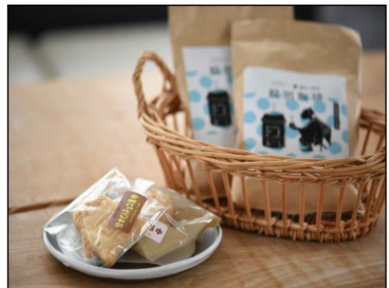
サイエンスカフェの様子と紋別高等養護学校生徒の食器で提供するカフェメニュー