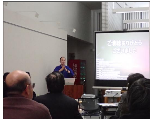
地元高校生の通訳ボランティアと研究者の交流会・職員によるシンポジウムでの講座