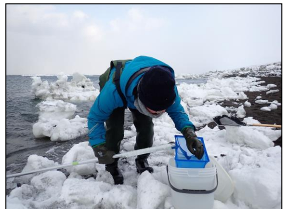
フェイスブック掲載のクリオネと職員によるクリオネ採取の様子