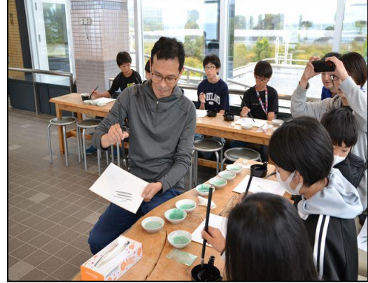
アート＆サイエンス 錫を使ったアクセサリー作りと鉱物絵具を使った日本画ワークショップ