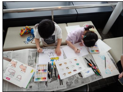
写真撮影教室とお絵描き教室