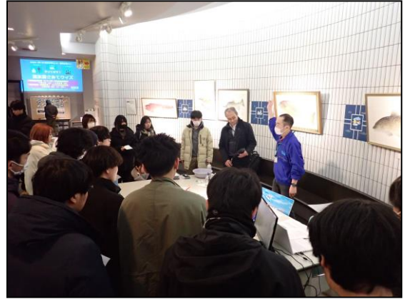
職員による観光客や大学への知識普及活動