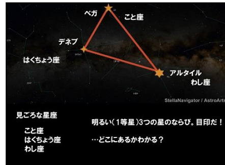
宇宙科学の普及 (イメージ)